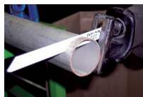
鋼管を切断する様子

湾曲した独自形状の鋸刃で特許取得※1 切断速度 1.5 倍、寿命約 3 倍を実現※2