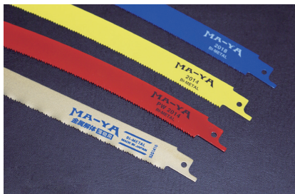
各種セーバーソーブレード