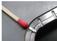
肉盛り部分とマッチ棒の比較