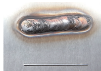
TIG溶接とレーザー溶接の比較