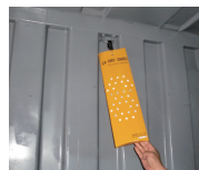
EX - DRY 300SU