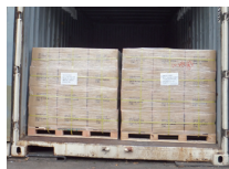
コンテナの除湿に