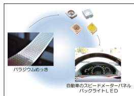
パラジウムめっき

現在、150HV以上の硬さを有し、電気特性に優れた硬質銀めっき液を自社オリジナルで開発し、量産化を進めています。耐摩耗性及び電気伝導性に優れた硬質銀めっきは、大電流・高電圧製品の端子・コネクタ部分に適しためっきです。当社の強みである連続めっき加工技術との組み合わせで、安定した品質と高い生産性を実現します。