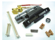
ディスク読取レンズホルダー・SDスロットカバー類・ケーブルコネクタ類・お守りストラップ