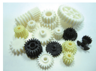
ギアブリー 用途：自動販売機など