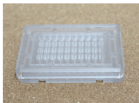
樹脂製品での嵌め併せ