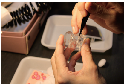
手作業でのバリ取り