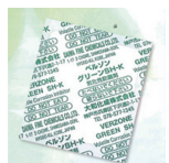
小袋に充填された非亜硝酸系酸化性防錆剤