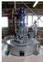
紫外線吸収剤の反応装置