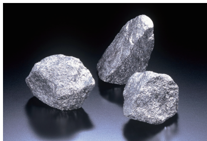
フェロモリブデン