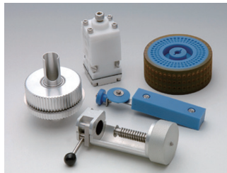
エンジニアリングプラスチック+異種材料