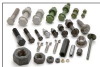
ベーシックファスナー