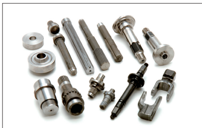
熱間・冷間鍛造部品、複合部品