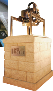
モニュメント (神戸ルミナリエ 希望の鐘)