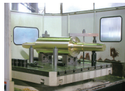
遠心鋳造品 + 砂型鋳造品 + 鍛造品を一体物に溶接組立した製品