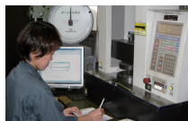
品質を支える検査設備