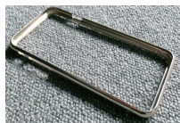
スマートフォン向け 薄板ケース加工